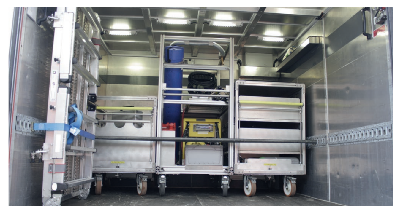
Ladungssicherung mit Zurrmitteln

Die Ladung ist so zu verstauen und zu sichern, dass bei üblichen Verkehrsbedingungen eine Gefährdung von Personen ausgeschlossen ist. Dabei darf das zulässige Gesamtgewicht des Einsatzfahrzeuges nicht überschritten werden. Die Ladung muss bei Bedarf mit geeigneten Zurrmitteln z. B. Zurrgurten oder Zurrketten gesichert sein.