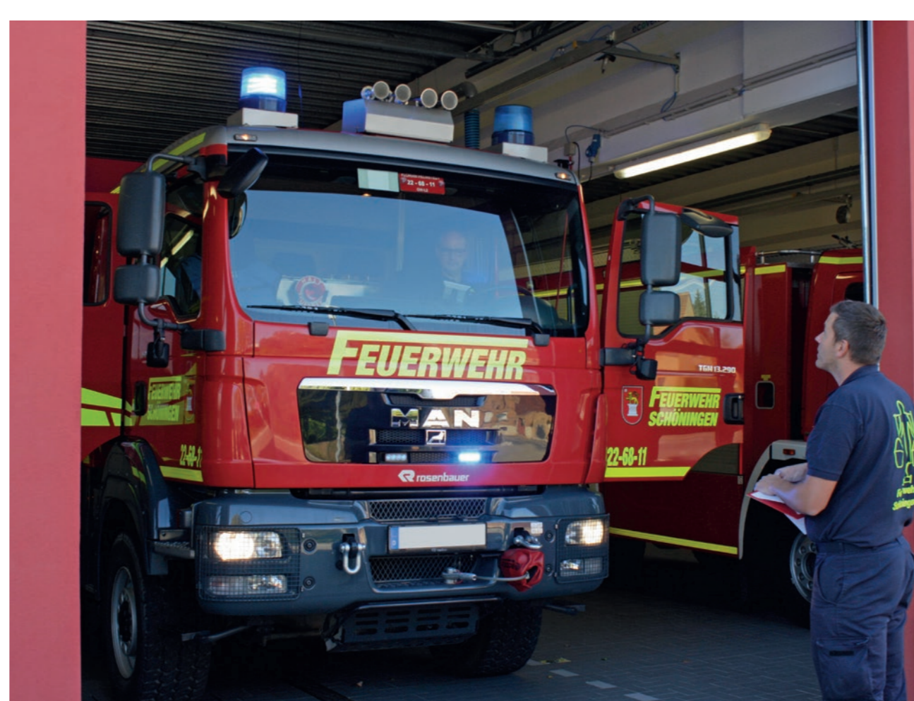
Kontrolle der Beleuchtung des Fahrzeugs