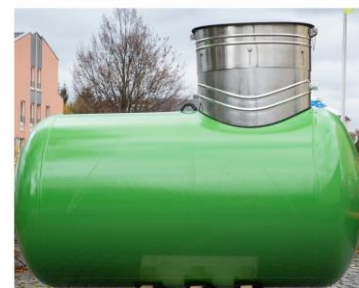
Armaturen eines Flüssiggastanks (oben), oberirdischer Tank (Mitte) und erdgedeckter Tank (unten).

Kontakt Flüssiggas-Sicherheitsdienst: 069-75 90 9-15 3