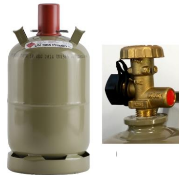
Flüssiggasflasche mit Ventilschutzkappe (links), freiliegendes Flaschenventil (rechts).